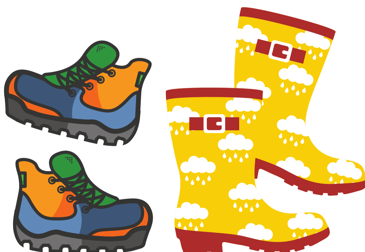
bottillons ou bottes de pluie