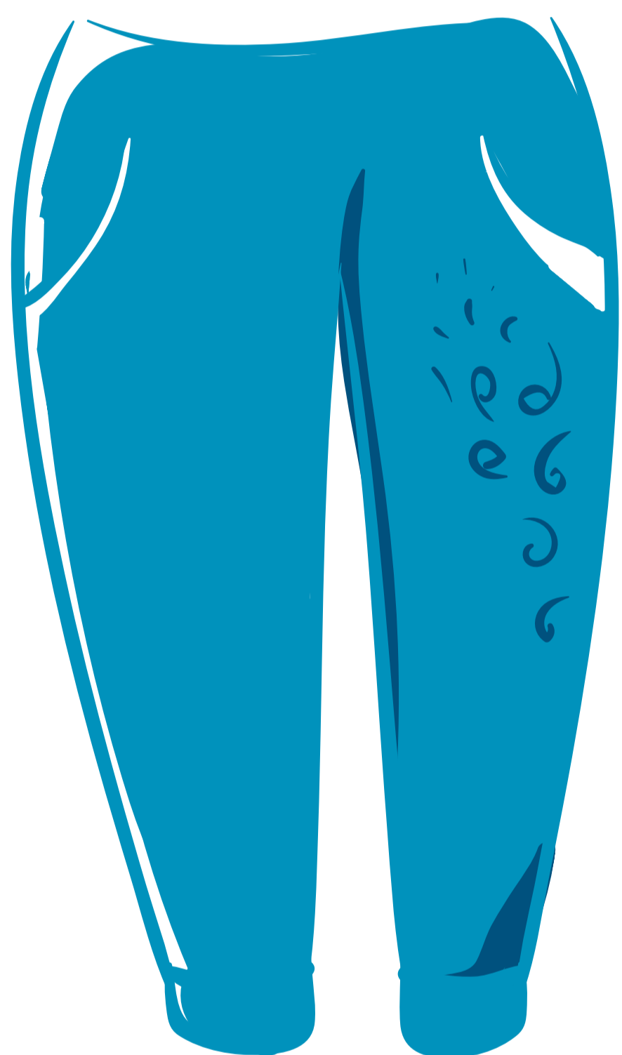
pantalon de nylon