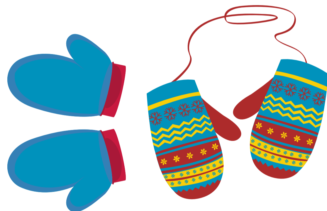
2 paires de mitaines